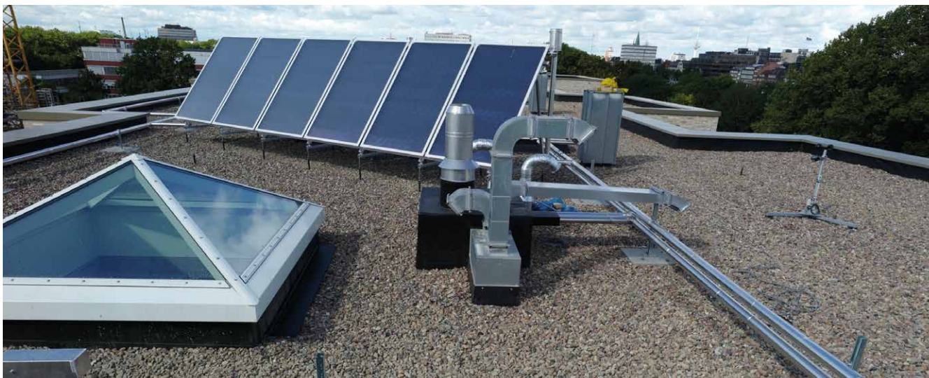
MERIDIAN-Dach: sicher gegen Wasser dank Wolfin GWSK.

2012 konnten die 54 Wohnungen bezogen werden. 2013 folgte schließlich an derselben Straße die Fertigstellung der Mehrfamilienhäuser NAUTICO, PENINSULA und LAGUNA mit jeweils 27 Wohneinheiten. Alle Entwürfe sind Ergebnis von nationalen und internationalen Architektenwettbewerben. So unterschiedlich die vier- bis fünfgeschossigen Wohnanlagen auch in der äußeren Architektur sind – offensichtlich sind der ambitionierte Gestaltungswille und die durchgängig hochwertige Ausführung und Ausstattung bis ins Detail. So auch bei der Abdichtung. Hier fiel die Wahl zum einen auf die Hochwert-Kunststoff-Dach- und -Dichtungsbahn Wolfin. Und zum anderen auf das renommierte Dachdeckungsgeschäft Helmut Kröff GmbH & Co. KG, das seit mehr als 200 Jahren mit heute über 30 Mitarbeitern in ganz Norddeutschland tätig ist ( www.kroeff.de ).