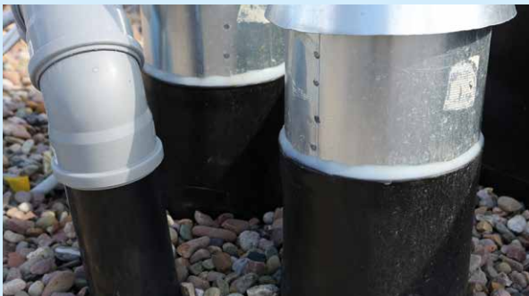
Diffizile Detailarbeit: handgefertigte Manschetten für die Rohre.