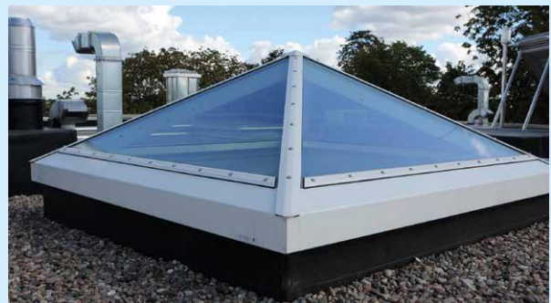
Lässt Sonnenlicht herein, aber kein Wasser: Pyramiden-Lichtkuppel.