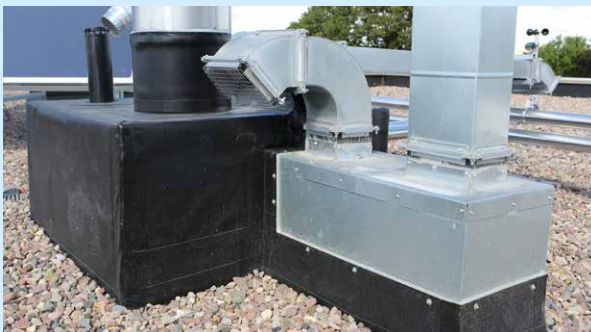
Haustechnik auf dem Dach: Abdichtungsarbeit für Profis und Profi-Material.